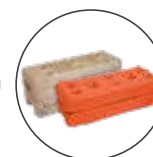
Blocchi in CLS e ABS, Ø foro 42 mm